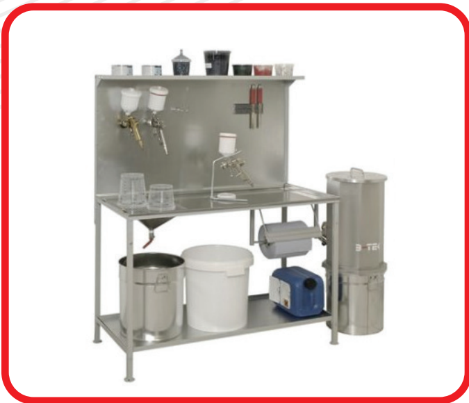
AT01 Rüst- & Misch Tisch 1.18 x 0.61 x 1.42 m Arbeitsfläche in Edelstahl, mit Ablaufwanne 4 Pistolenhalter, 1 Papierrollenhalter, Mg Leiste