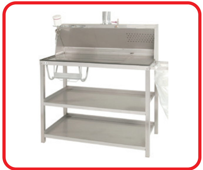
AT02 Rüst- & Misch Tisch 1.18 x 0.61 x 1.42 m aus Edelstahl/Alu, mit Kantenschutz, pneum. Absaugung, Abfallsackhalter und Ablageböden