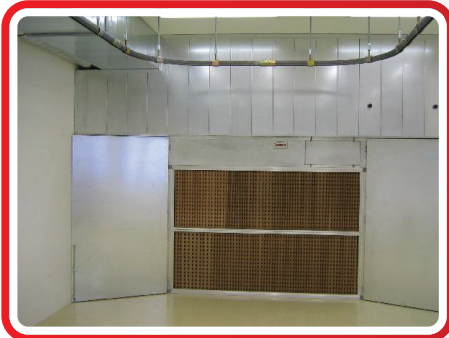
Spritzraum mit Hängebahn

Nutzen Sie dieses Formular für Ihre Anfrage