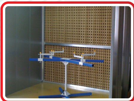
Spritzstand Typ BTK