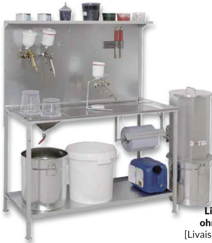
Abb. zum Belsplet mit Sammelstation RST-01

[Exemple avec station de collecte RSt-01]