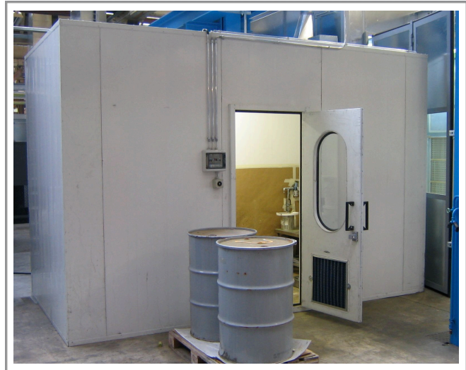
Beispiel Mischraum mit Abluft und Beleuchtung